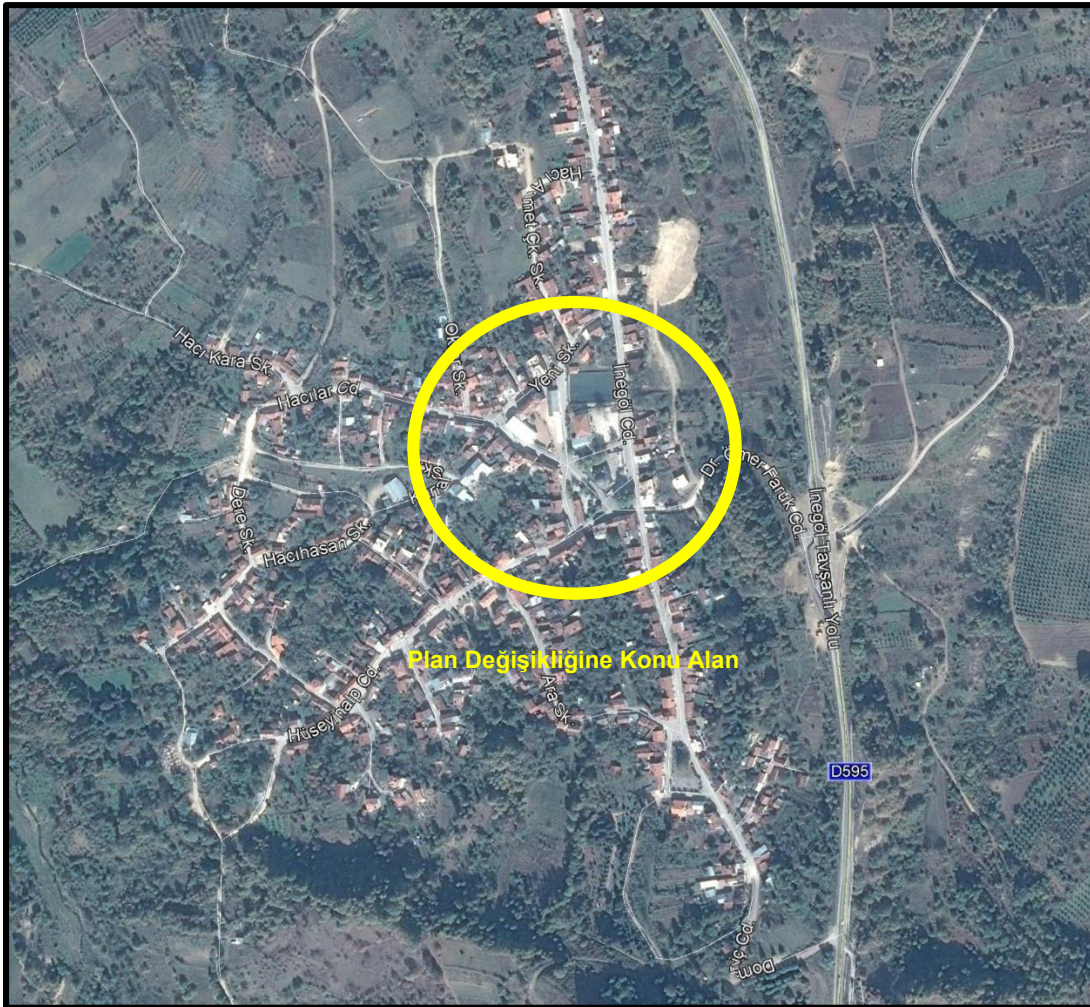
Şekil 1: Plan Değişikliğine Konu Alanın Konumu

Plan değişikliğine konu parsellerin bulunduğu alan; Tahtaköprü Mahalle merkezinde yer almakta olup, İnegöl-Tavşanlı (D595) Karayolunun yaklaşık 200 metre batısında konumlanmıştır. Plan değişikliğine konu parseller; İnegöl Caddesi, Hacılar Caddesi, Hüseyinalp Caddesi, Domaniç Caddesi ve Yeni Sokağa cephelidir.